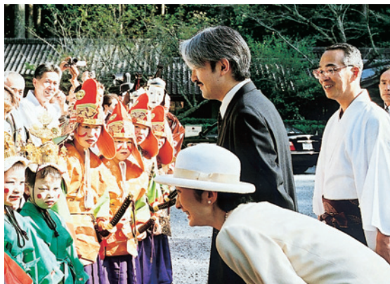
舞楽奉仕者をお励まし賜わる