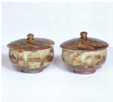
両殿下御使用の森山焼湯呑み (謹製・松井 晴山氏)