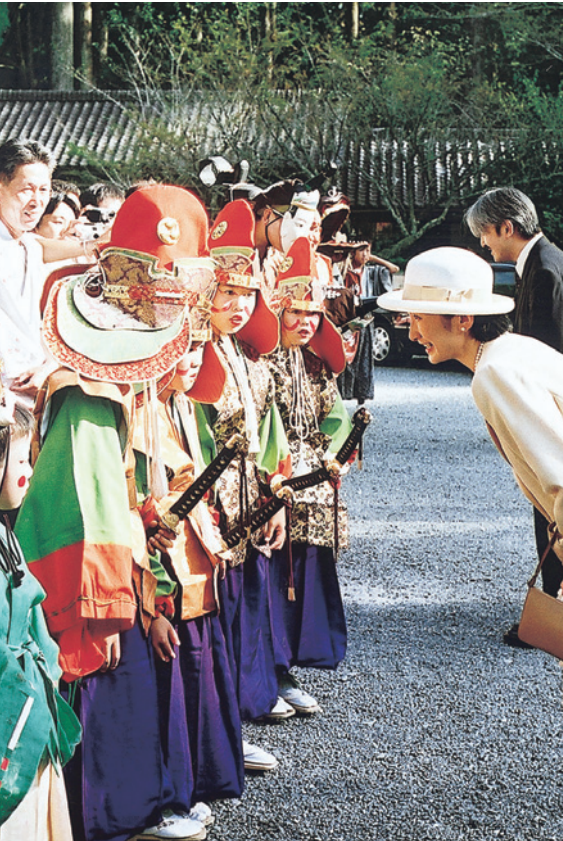
舞楽奉仕者をお励まし賜る