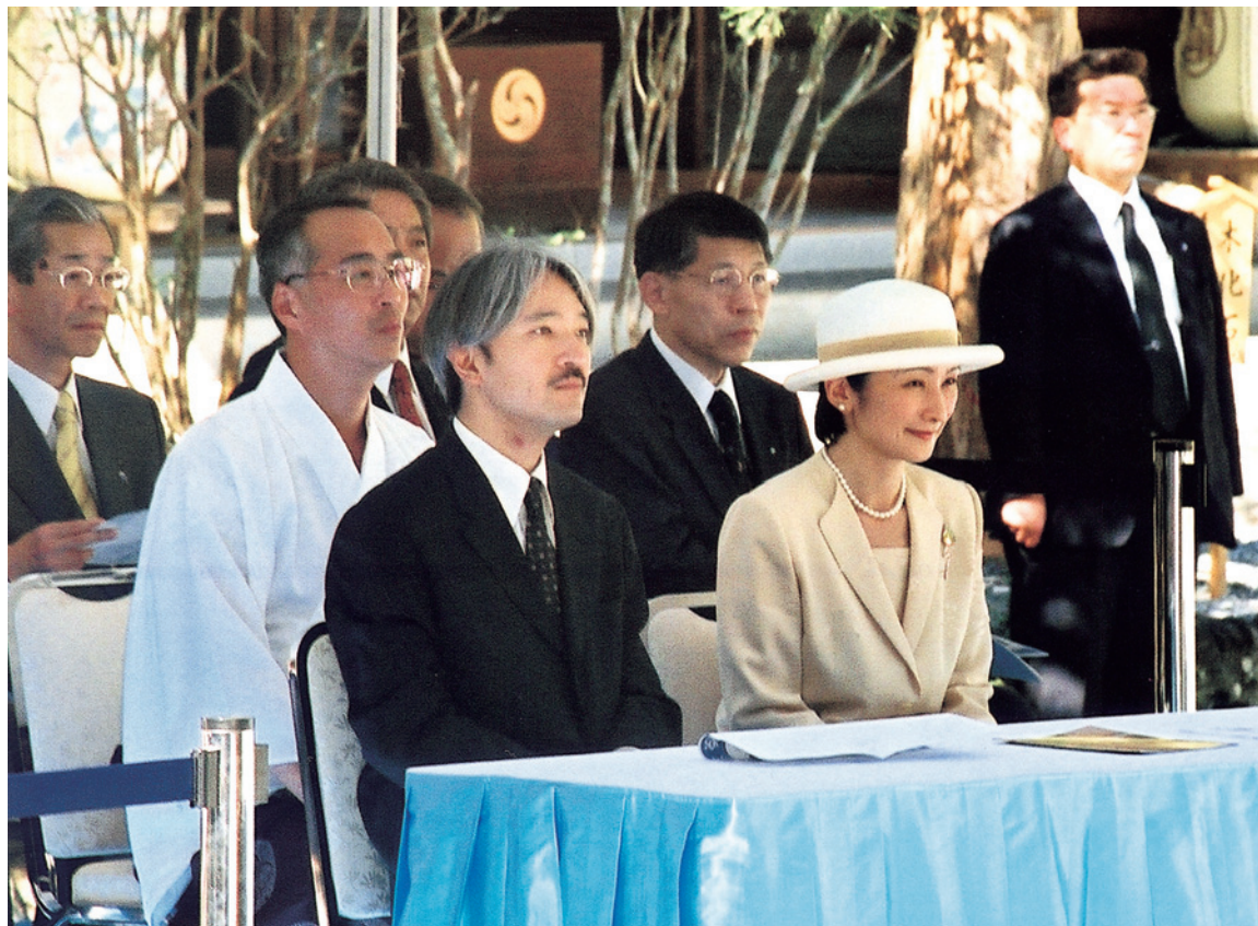
十二段舞楽を御覧