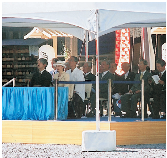
十二段舞楽を御覧